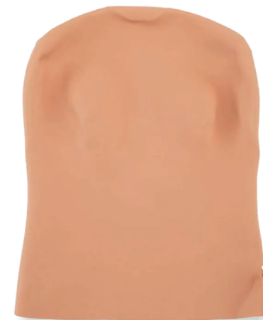
Ersatzhaut Replacement skin