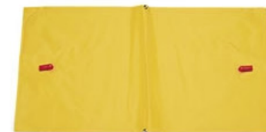
Ersatzlunge Replacement lung