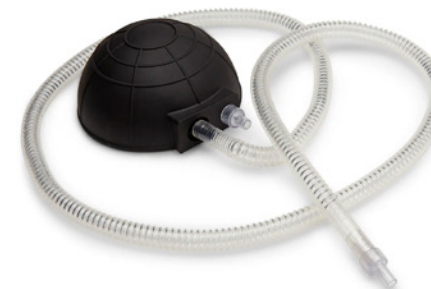
Ersatz Fußpumpe mit Schlauch Replacement foot pump